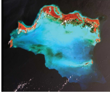
صورة التقطتها أحد سواتل وكالة ناسا، وتظهر فيها جزر تركس وكايكوس

تتمتع خمسة من الأقاليم غير المتمتعة بالحكم الذاتي بمركز العضو المنتسب في منظمة الأمم المتحدة للتربية والعلم والثقافة (اليونسكو)، وهي أنغويلا وتوكيلاو وجزر فرجن البريطانية وجزر كايمان ومونتسيرات.